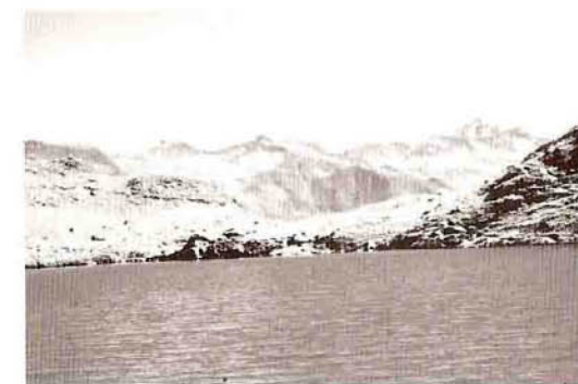
Lac Noir et chaîne de la Lauzière

Il attire de nombreux randonneurs et le lac Noir est considéré comme le lieu de pique-nique idéal dans la région, surtout parce qu'on atteint facilement les 2000m du lac et que l'on gravit le Grand Arc sur un chemin de crête très large. C'est aussi, au printemps, un classique du ski de randonnée.