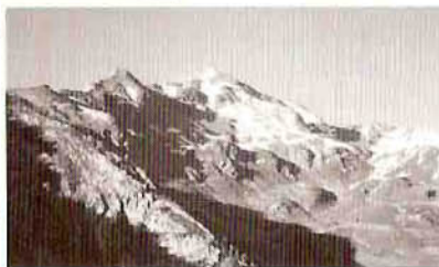
Le Grand Arc

Le retour au lac se fait par le même itinéraire.