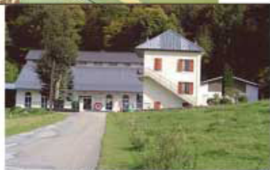
Centrale hydroélectrique Cayrol