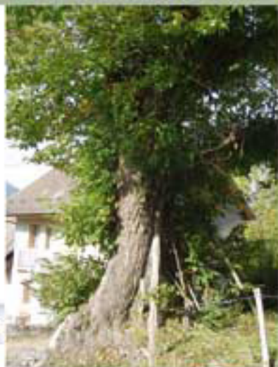
Le châtaignier séculaire